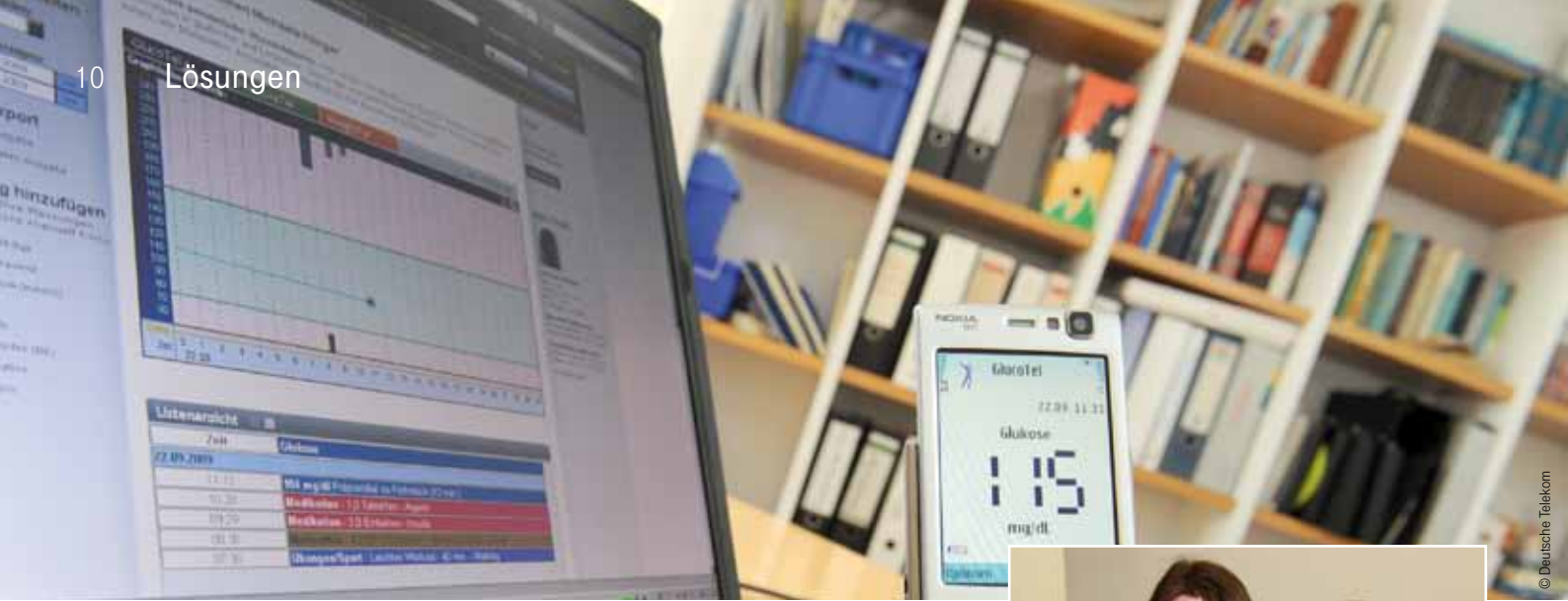
Die Komponenten von GlucoTel: Messgerät, Handy und Online-Tagebuch.